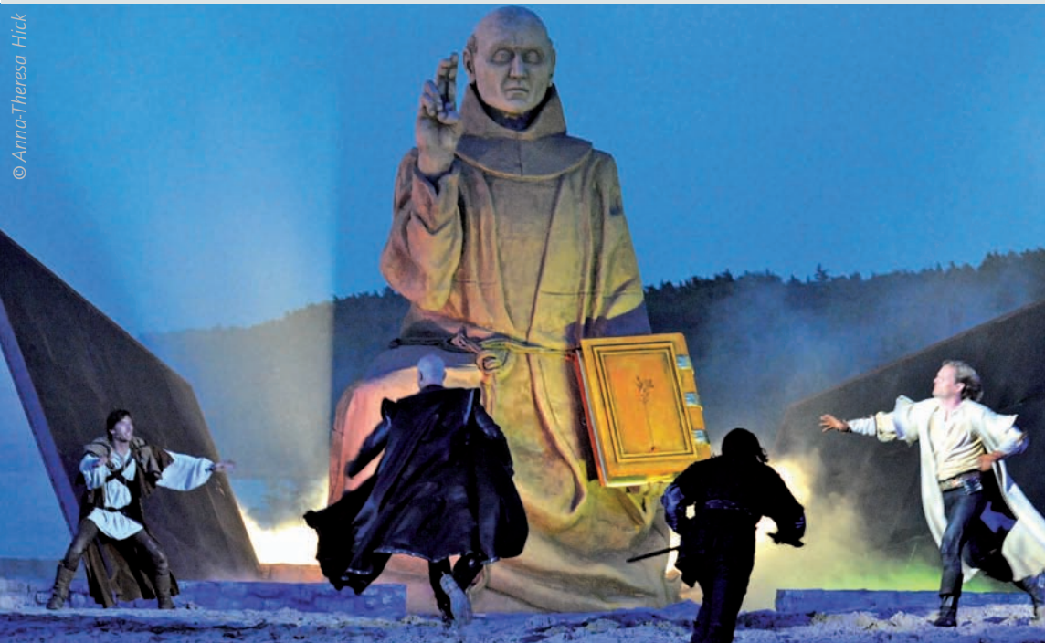
Der zweite Teil der Störtebeker Trilogie endete mit der Auferstehung des Heiligen Antonius aus dem Sand – gespannt wird die Fortsetzung ab 18. Juni erwartet.