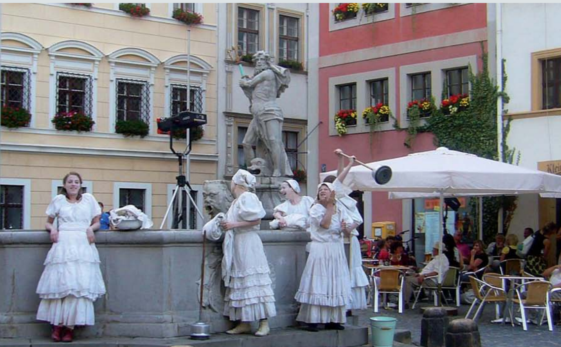
Buntes Treiben in der gesamten Stadt während des alljährlichen Straßentheaterfestivals »ViaThea«