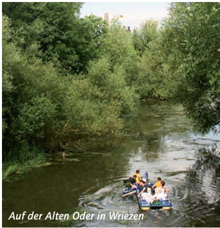
Auf der Alten Oder in Wriezen

Auch für Radfahrer ist das Oderbruch ideal, weil das Land so schön flach und wenig Verkehr auf den Straßen ist. Von Wriezen lässt sich zum Beispiel Neulietzegörick, das älteste Kolonistendorf, besuchen. Wem der Sinn nach ortstypischen Spezialitäten steht, fährt von Wriezen nach Zollbrücke und kann dort mit etwas Glück Quappen essen, ein seltener, begehrter Speisefisch. Dass es ihn hier zu bestellen gibt, hängt damit zusammen, dass sich diese Fische in der Oder sehr wohl fühlen. Weiter südlich beim Ort Güstebieser Loose können die Fahrräder für einen Ausflug ins schöne polnische Grenzland auf eine Fähre geschoben werden. Allerdings ist diese ausgedehnte Tour nur geübten Radfahrern zu empfehlen.