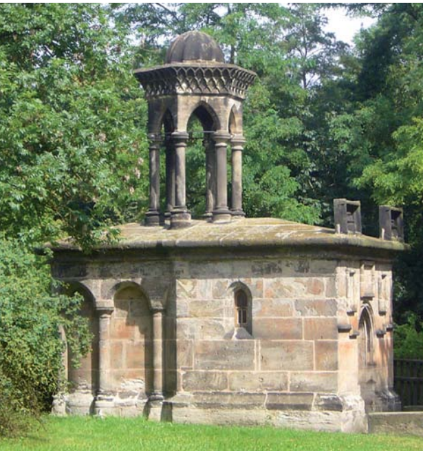
Das Ergebnis einer Pilgerreise

Die Grabeskirche mit dem Grab von Jesus Christus steht wie wir wissen in Jerusalem. Die Grabeskirche, so wie sie von den Kreuzfahrern angelegt wurde, die 1099 in die heilige Stadt kamen, steht allerdings in Görlitz.