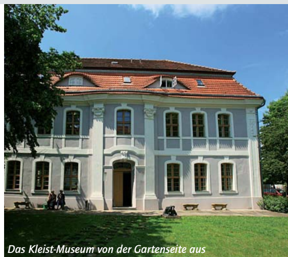
Das Kleist-Museum von der Gartenseite aus

Faberstraße 7, 15230 Frankfurt (Oder) Tel. 0 335/531155, www.kleist-museum.de geöffnet: Di–So, 10–18 Uhr