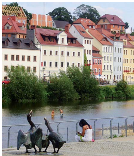
Blick über die Neiße nach Zgorzelec