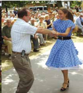
Links: Erlebnis für alle Sinne – der Kräutergarten Rechts: »Danz op de Deel«, ausgelassene Stimmung auf dem Hofgelände