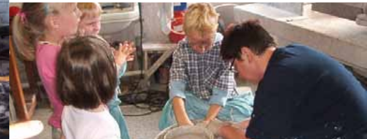
In der Töpferei können Kinder unter Anleitung kreativ werden

Wer bekommt schon einen handgeschwämmelten Pfefferkuchenteller geschenkt! Dank seiner reichen Tonvorkommen hat das Töpferhandwerk hier seit Jahrhunderten Tradition. Am 1. Adventswochenende lädt die Töpferei Holland in Elstra ( Halštrow ) zu Stollen und Glühwein ein. Bei der großen Weihnachtsausstellung können Sie schöne, tönene Weihnachtsgaben erwerben oder selbst welche töpfern und bemalen. Tel.: 035793/5281, geöffnet 10–18 Uhr. www.toepferei-holland.de