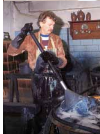
Seit 300 Jahren wird hier in Handarbeit gefärbt