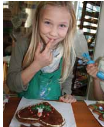
Selbstgemachter Pfefferkuchen schmeckt noch mal so gut

Ebenfalls in Pulsnitz: Die vermutlich älteste deutsche Blaudruck-Manufaktur. Verbinden Sie doch Ihren Besuch im Pfefferkuchenmuseum mit einer Visite beim Blaudrucker und schauen Sie ihm über die Schulter, wenn er Baumwoll- und Leinenstoffe mit Holzformen bedruckt. Dann haben Sie beim nächsten Adventskaffee was zu erzählen! Anmeldung unter Tel.: 035955/73873, geöffnet Mo-Fr 9–17 Uhr, Sa 9–12 Uhr. www.blaudruckpulsnitz.de