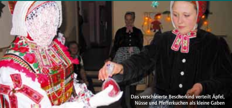
Das verschleierte Bescherkind verteilt Äpfel, Nüsse und Pfefferkuchen als kleine Gaben