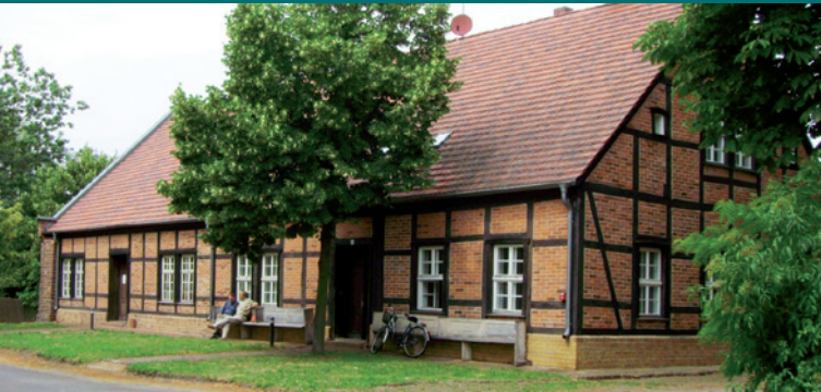
Schul- und Bethaus Altlangow

Reisen Sie mit uns ins 19. Jahrhundert, als der Königliche Baumeister Carl Friedrich Schinkel (1781–1841) mit seinen architektonischen Meisterwerken die Mark Brandenburg verschönerte. Einfach mit der ODEG Linie OE60 nach Letschin fahren und durch die malerische Landschaft des Oderbruchs radeln!