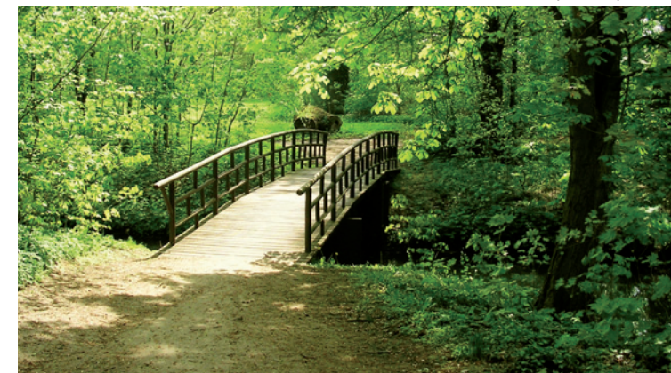
Brücke im Naturpark Wollup

Auch die Restauration der abgebrannten Stadtpfarrkirche Seelow hat sich gelohnt! 1630 im gotischen Stil erbaut, wurde das Gebäude 1830 von Schinkel in klassizistischer Form wiedererrichtet. Bevor das Ergebnis dieser erstaunlichen Verwandlung besichtigt werden kann, müssen die Teilnehmer zum Abschluss der Tour jedoch noch die einst umkämpften Seelower Höhen erklimmen – und einen atemberaubend weit schweifenden Blick auf das Oderbruch werfen, das offiziell seit dem 19. Jahrhundert als „Gemüsegarten Berlins“ galt. Das Oderland – eine natürliche, klassizistische Schönheit mit modernen Zügen! Ab Seelow können Sie mit der ODEG Linie OE60 wieder zurück in die Gegenwart fahren.